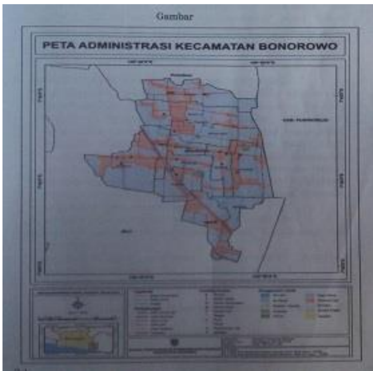
Gambar 1 Peta Administrasi Kecamatan Bonorowo