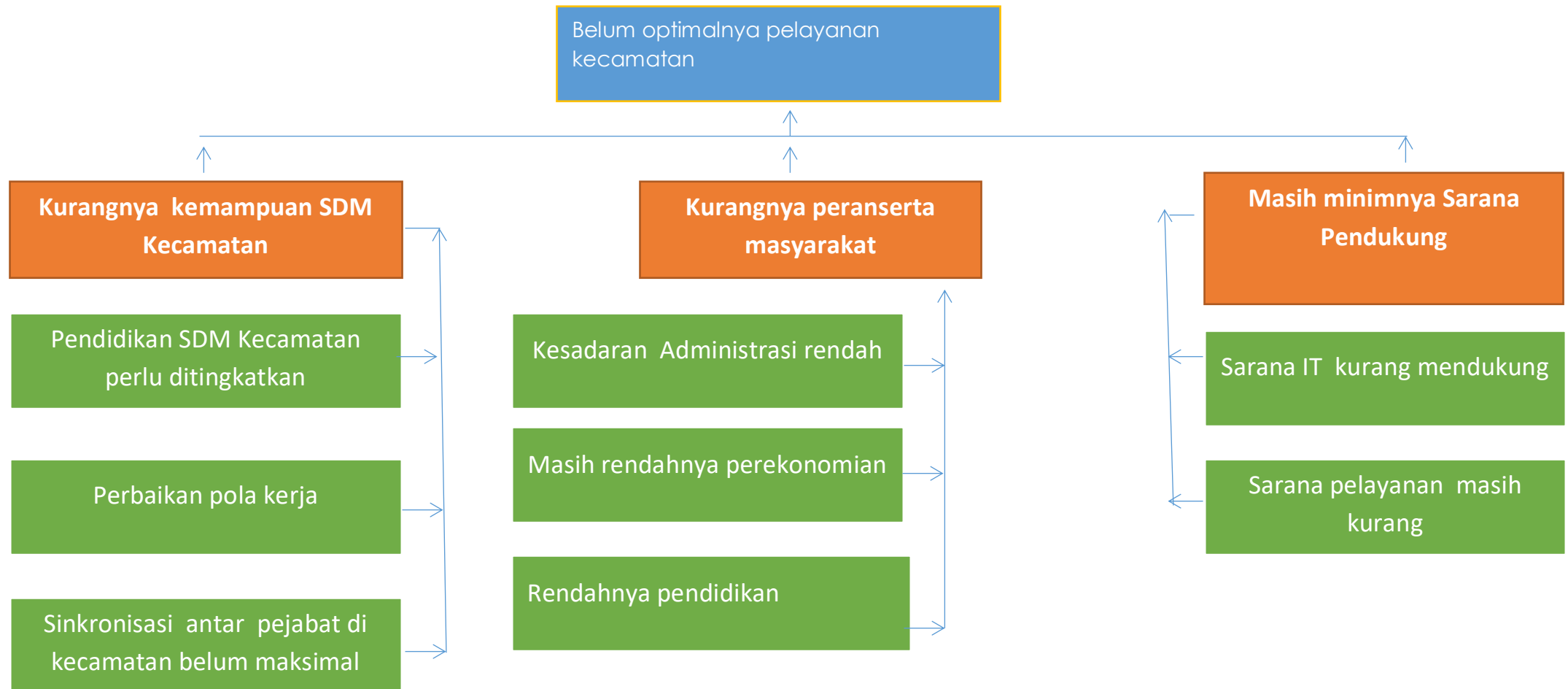
Gambar 3.1. Pohon Masalah